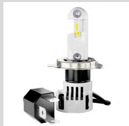
LEDDriving® HL INTENSE H4/H19