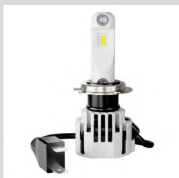
LEDDriving® HL INTENSE H7/H18