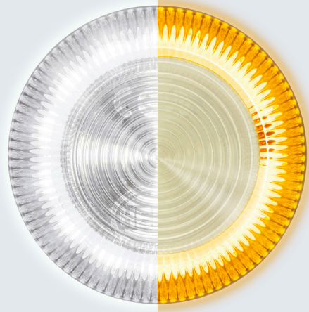
Bílé pracovní světlo